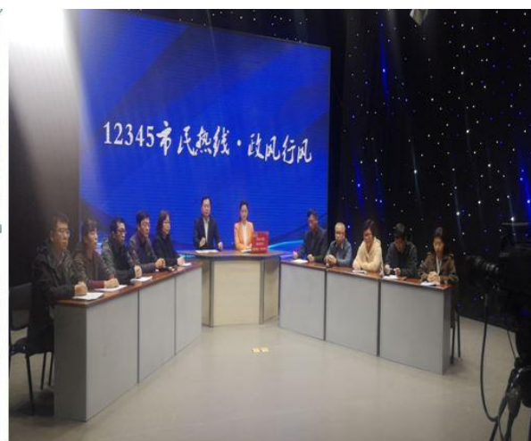
聊城市农业农村局参加市民热线接线