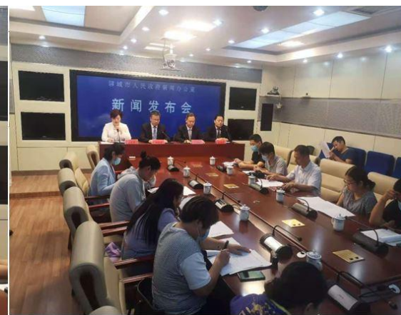
市农业农村局参加资源环境领域改革攻坚推进情况新闻发布会

五是实行重大事件网络直播。与聊城电视台、聊城报业传媒等媒体合作，实行重大活动全程网络直播。对在北京、上海举办的“聊城推进新旧动能转换绿色高效农业合作恳谈