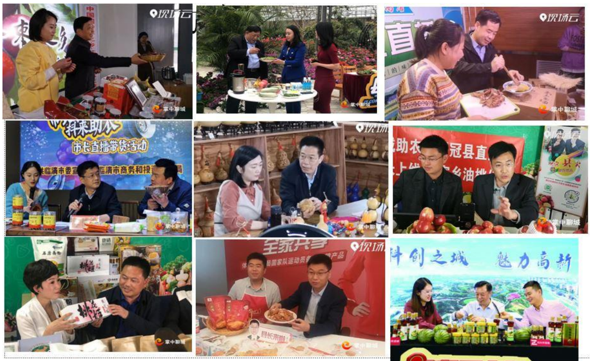
聊城市“县长优选”进行县域农产品等电商直播带货

会”、京沪高铁“聊·胜一筹!”品牌专列首发仪式、“中国农民丰收节”等活动进行了全程网络直播，社会反响十分热烈。2020年4月组织开展网络助农系列公益活动，聊城市“县长优选”进行县域农产品等电商直播带货活动。2020年11月邀请全国40余家媒体走进“聊·胜一筹!”品牌农产品原产地进行集中采访、宣传。